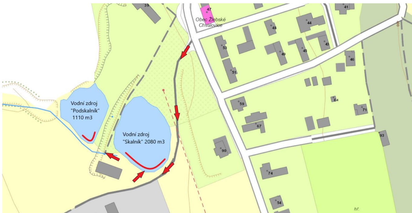
Vodní zdroj „Podskalník“ 1110m 3 a „Skalník“ 2080m 3