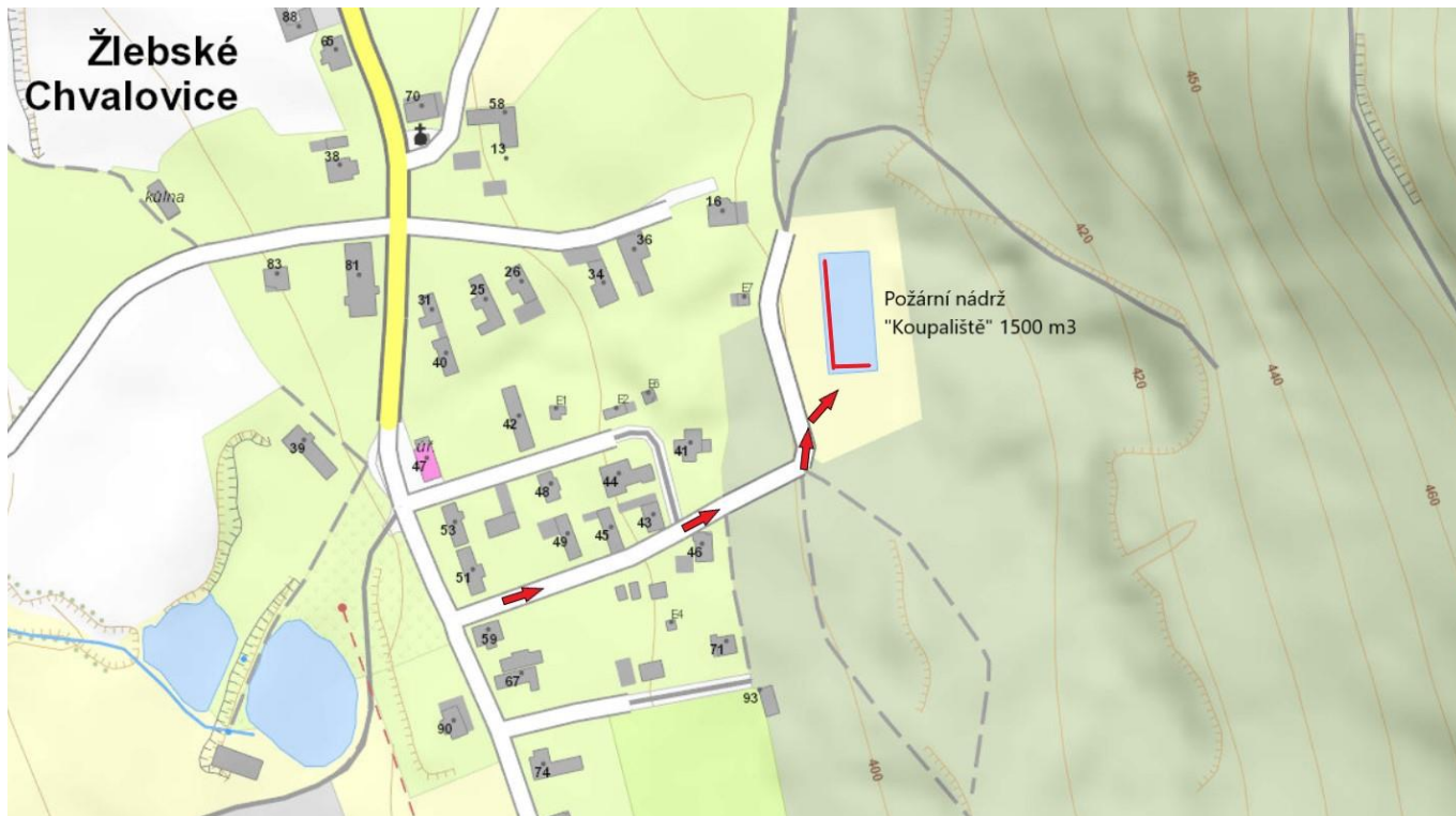
Požární nádrž „Koupaliště“ 1500m 3