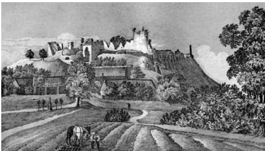
Rytina z roku 1846 nám přibližuje, jak vypadalo okolí zříceniny hradu Lichnice. Vlevo vidíme křížek u cesty doplněný čtyřmi lípami. (F. A. Heber)

zámek v Podhořanech. V roce 1815 byla postavena první filiální škola na ronovském panství, a to v Kněžicích. Následovala škola v Závratci.