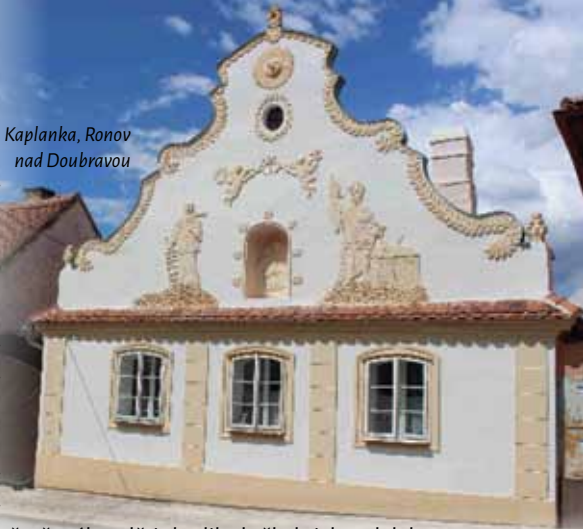
Kaplanka, Ronov nad Doubravou