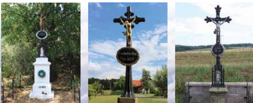
Křížek Žlebská Lhotka, Sušice, u cesty na Biskupice

Už Marie Terezie zakazovala kvůli častým požárům stavbu domů ze dřeva, tedy roubenek. Ve skutečnosti to trvalo ale ještě dlouho, než se zvyklosti ve stavbě venkovských domů změnily.