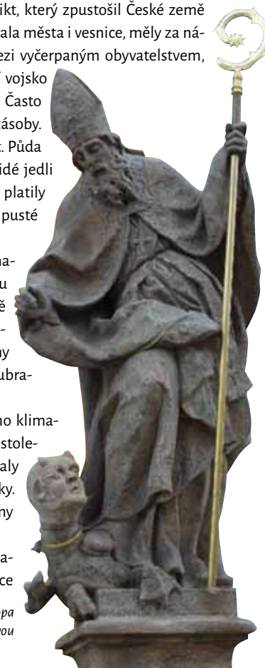
Socha sv. Prokopa v Ronově nad Doubravou

V této válce v roce 1637 převzal hrad Lichnici (nedávno ustanovenou jako své léno) císař Ferdinand II. V té době byla Lichnice