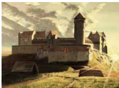
Idealizovaná rekonstrukce hradu Lichnice - pohled od severu, L. Herz, www.hrady-zriceniny.cz

V roce 1437 se konala korunovace Barbory, manželky Zikmunda Lucemburského „Lišky ryšavé“ na českou královnu. Při té příležitosti jí Zikmund zapsal tradiční