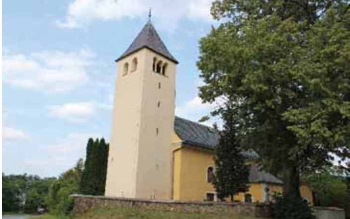
Románský kostel Máří Magdalény v Pařížově

I v nedaleké Běstvině byl již v době románské kostel a románská je hlavní část kostela sv. Martina a sv. Kříže u řeky Doubravy, u nichž tehdy také existovaly osady. Kromě archeologických nálezů jsou to právě tyto stavby, které jakoby ukazují trasu obchodní stezky.