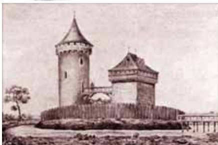
Takto možná mohla vypadat tvrz v Běstvině na ostrovu v rybníčku nedaleko zámku – www.obec.bestvina.cz

Úvozy (tedy zahloubení cesty) rychle vznikaly v prudších úsecích, kde se kola vozů protáčela, koně a dobytek museli více zabírat a hlína a kamení se drojilo. Mnohdy vedly v takových místech i dva úvozy vedle sebe. Jedna cesta sloužila pro cestu do kopce a druhá dolů. Především po deštích byla sjízdnost s plně naloženým vozem nebezpečná, často se jelo smykem a na jedné cestě by se mohly vozy srazit nebo nekontrolovaně rozjet. I úvozy, dnes často zarostlé, jsou pamětí krajiny. Vypráví nám o tom, kudy se dříve lidé pohybovali. Dva úvozy v prudkém kopci