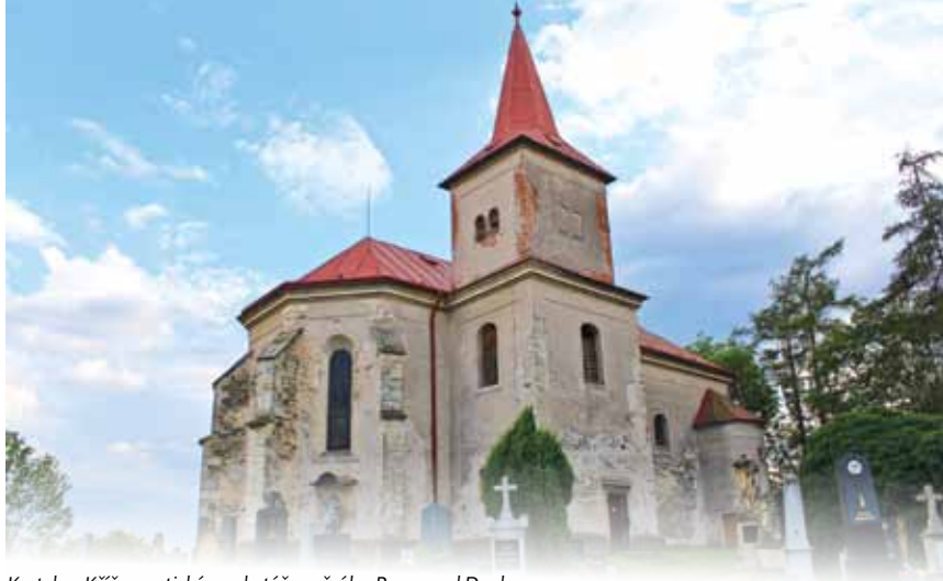
Kostel sv. Kříže – gotický presbytář s opěráky, Ronov nad Doubravou

představovaly asi třetinu všeho, co lidé vypěstovali. Renta se vybírala v penězích, ale i v naturáliích, tedy plodinách. Vybírala se na podzim na sv. Havla po letní sklizni a na jaře na sv. Jiří. Poslední část renty představovala robota, tedy neplacená práce pro vrchnost. Ta ale ve 14. století nepřesahovala 18 dní v roce.