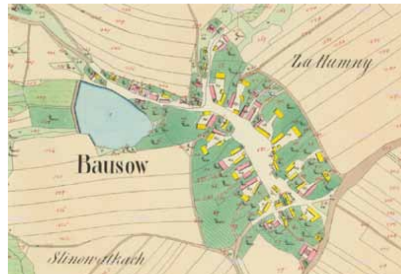
Výřez mapy stabilního katastru vesnice Bousov z roku 1838 – je vidět původní založení statků kolem obdélné návsi. Za domy jsou zahrady a za nimi pravidelné pruhy polí.

Ve 13. století panovník začal hojně rozdělovat půdu své země, která mu do té doby v pod-