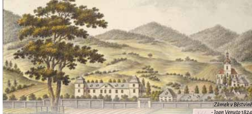
Zámek v Běstvíně - Joan Venuto 1824

Roku 1618 začalo stavovské povstání nekatolických českých stavů proti katolickému císaři. Stavovského povstání se účastnili nejen Robmháповé, ale i majitelé panství Běstvína. Povstání dopadlo špatně prohranou bitvou na Bílé hoře v roce 1620 a císař začal trestat: pro výstrahu popravil 27 předních vůdců povstání a zabavoval majetek. Robmháповům byl majetek změněn na císařské léno. Tedy to už nebylo jejich vlastnictví, ale měli jej od císaře pouze zapůjčené. Majitel