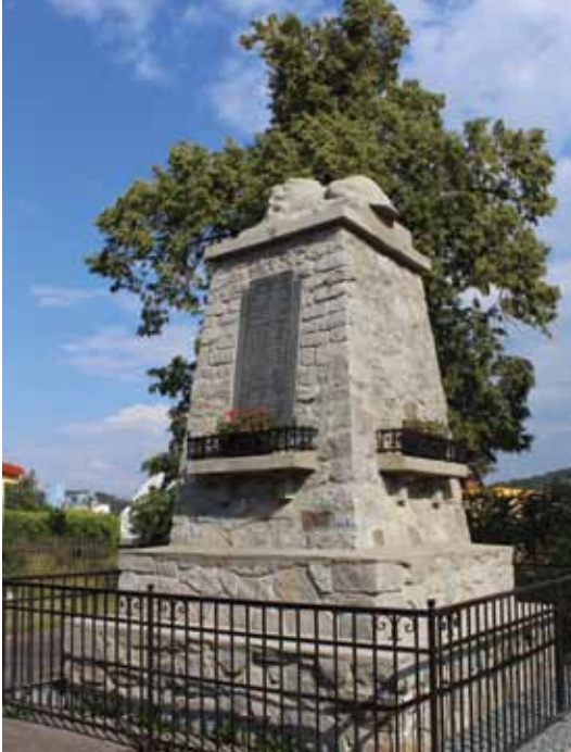
Pomník padlým v Prachovicích

diktatuře se poměrně rychle změnil obraz venkova i charakter zemědělství. Zakládala se zemědělská družstva, do nichž museli všichni povinně vstoupit. Kdo se zdráhal, tomu byly v jeho nepřítomnosti odvedeny krávy do JZD a podobně. Došlo ke znárodnění půdy a tím i k scelování pozemků do obřích lánů. Ze zemědělství se postupně stala vlastně průmyslová výroba, kde stroje zajistily většinu práce a člověk byl potřeba už jen jako jejich obsluha. To přineslo ulehčení od těžké fyzické dřiny, ale také vyprázdnilo krajinu. Zmizeli lidé s motykami, trakaři i povozy, zmizely kopyky sena i panáky obilí.