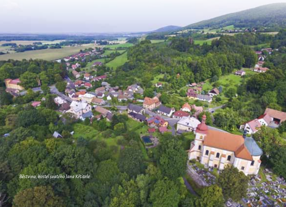
Běstvina, kostel svatého Jana Křtitele

Vítejte na procházce časem krajinou našeho mikroregionu, jeho vesnicemi, městečky a samotami. Pokusíme se přiblížit si, jak lidé v různých obdobích žili, jak vypadala příroda kolem nich a jak se jejich obyčejných životů dotýkaly změny panovníků, války či mír, epidemie nemocí a proměny klimatu. Zhlédneme, jaké stopy nám tato neobyčejná dramata do dnešních dnů zanechala.